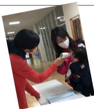
教室前の体調チェック