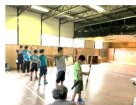
アーチェリー競技(8月2日)