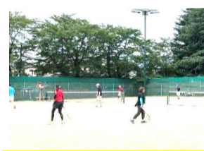
ソフトテニス競技(8月2日)