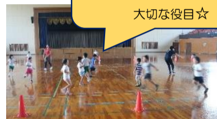
元気に駆け回るスポーツキッズたち