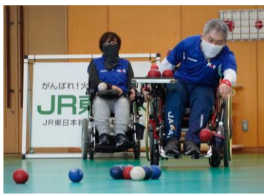
白河市での合宿の様子

コミュニケーションは選手やコーチなどに限定したものではありません。8月にJR東日本と日本ボッチャ協会がパートナーシップを結んだことにより、ここ白河市での強化合宿が開催されることになりました。この合宿開催にあたっては変更の変更が多くありましたが福島県農林水産部の協力による県南地区の農産物の提供をはじめ、