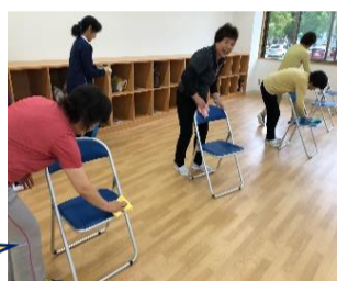
明るく元気な骨コツ健硬体操教室の皆さん