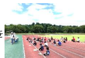
ソーシャルディスタンスで開会式