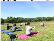
アフタヌーン公園ヨガ教室 ～自然を感じて～