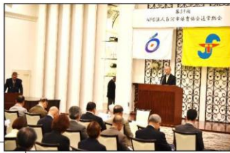
平成30年度通常総会の様子 (4/26)